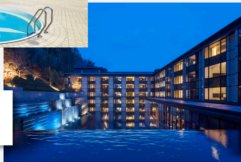
エクシブ 湯河原離宮 ...など