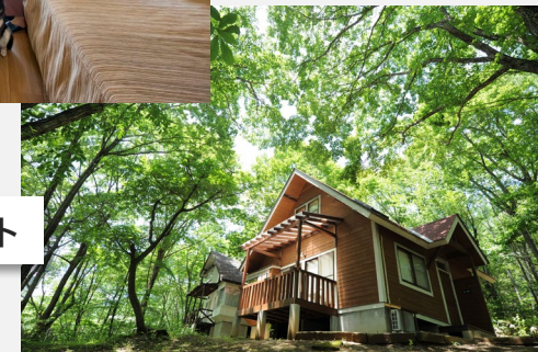
八ヶ岳高原リゾート ...など