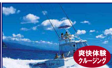
爽快体験クルージング