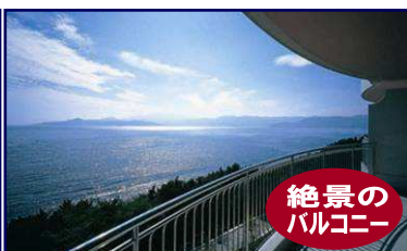
絶景のバルコニー